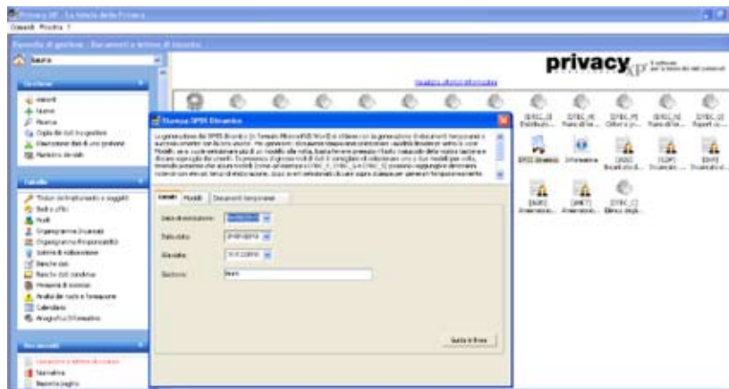
*Immagine della tabella per La stampa del DPSS Dinamico.

Privacy XP 10 compone in modalità dinamica il DPSS (Documento Programmatico sulla Sicurezza) sulla base dei dati e delle informazioni fornite dall'utente in fase di compilazione delle tabelle, permettendo così la redazione e l'aggiornamento di un documento perfettamente corrispondente alle esigenze della realtà aziendale di riferimento.